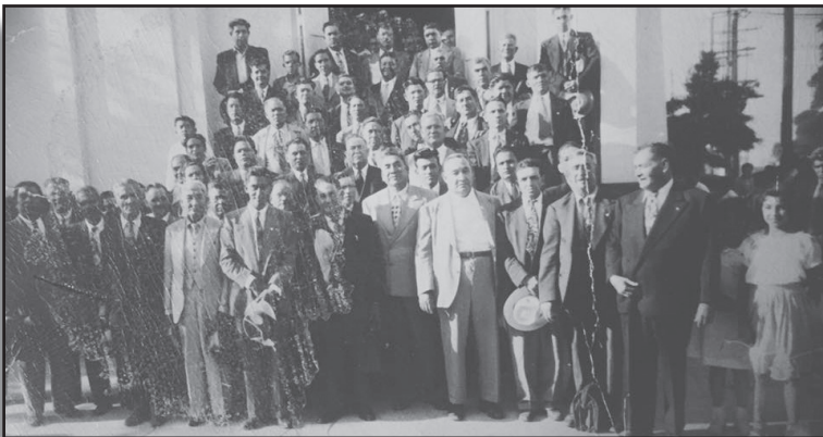
Convención en Los Angeles 1948

Aunque la iglesia se había incorporado en 1930, no fue hasta 1945 que la Asamblea Apostólica ratificó su primera Constitución. Desde 1929 hasta la ratificación de la Constitución, los acuerdos de la Convención General y de la Mesa Directiva General