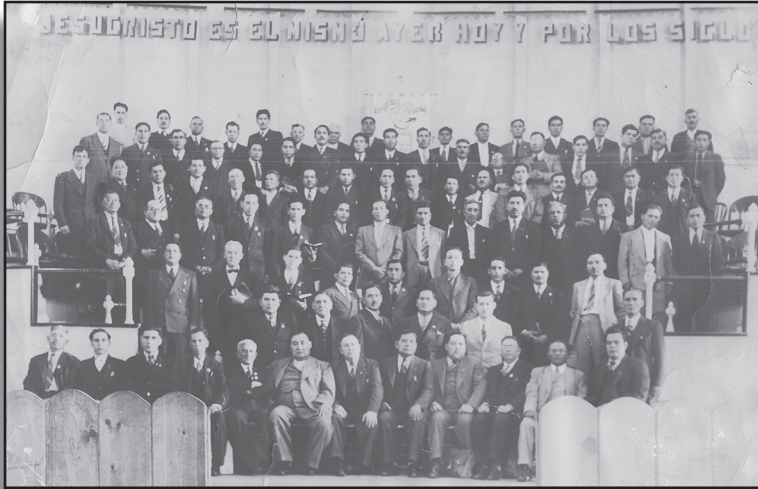
1935 Convención General